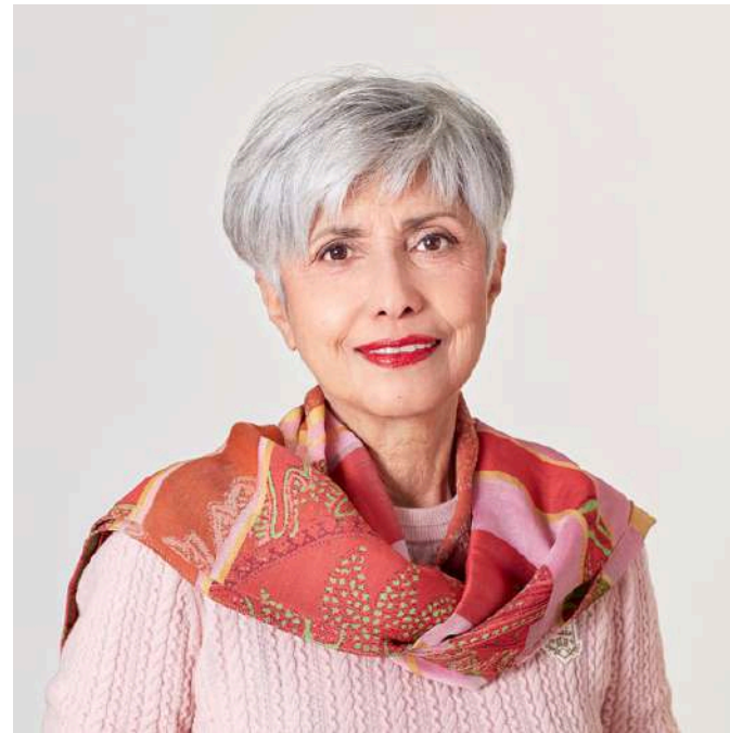
Méka Brunel France