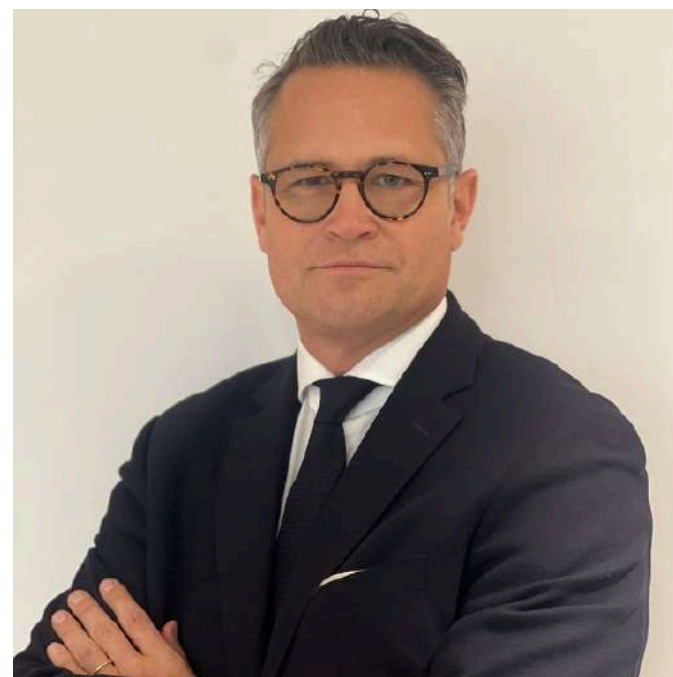
Romain Boudot France