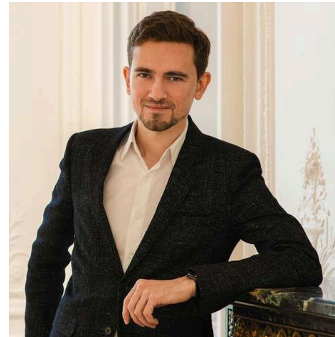
William Yon International