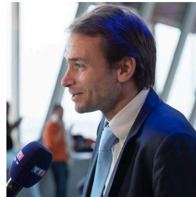
Grégoire Chauvière Le Drian Europe