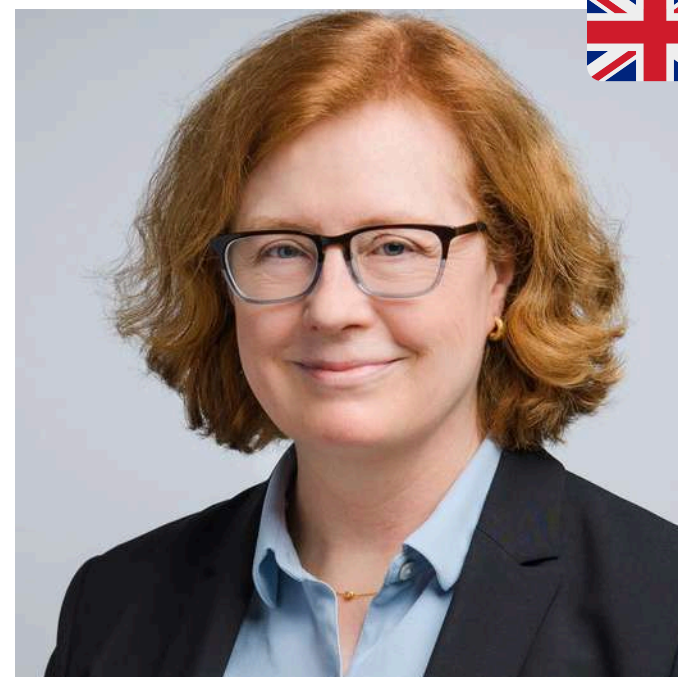
Anne B. Hardy International