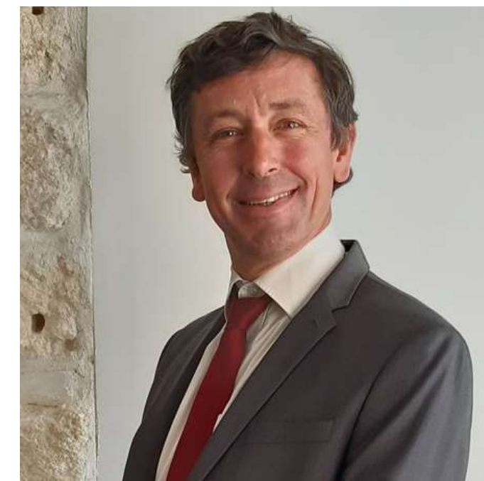
Guillaume Cayeux International