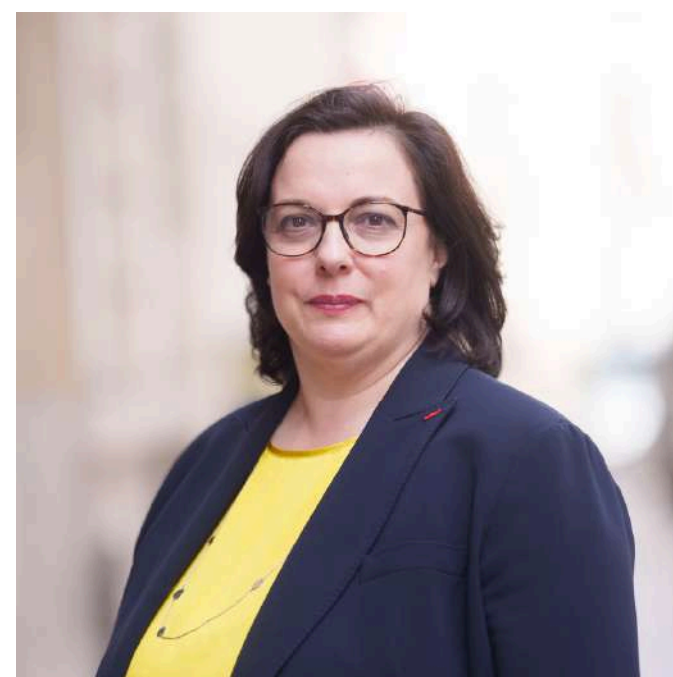
Emmanuelle Cosse France