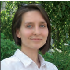
RUSSIE / RUSSIA

L'identification et l'analyse de l'évolution de « signaux faibles » représentent un enjeu important pour les processus de décision dans une entreprise. Ces mesures permettent à l'entreprise de ne pas rester dans la logique dominante, mais d'être flexible face aux changements, d'être anticipatrice sur son cœur de business qui a une durée de vie d'une vingtaine d'années.