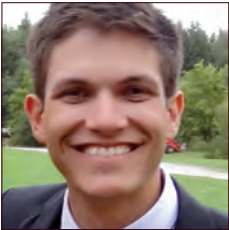
BRÉSIL / BRAZIL

Créée en 2010 par une équipe d'entrepreneurs experts des nouvelles technologies et de la mobilité, MOPeasy est une entreprise innovante des pôles de compétitivité qui a comme principal atout le développement de services innovants d'écomobilité qui s'adaptent et transforment les territoires, en prenant toujours en compte les aspects sociaux et environnementaux. Les solutions de MOPeasy sont destinées aux entreprises, collectivités et aux habitats collectifs. Pour ce dernier, l'entreprise se porte comme l'acteur précurseur en France. Actuellement, MOPeasy a trois actions en habitat collectifs en cours et d'autres projets à venir.