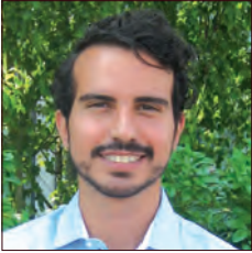
BRÉSIL / BRAZIL

Le développement durable constitue un axe prioritaire chez Renault. Cela se traduit par l'engagement pionnier du groupe dans l'économie circulaire. Le constructeur se démarque de ses concurrents à travers une stratégie de réemploi, rénovation et de recyclage.