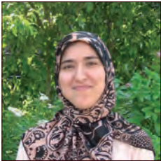
MAROC / MOROCCO

Avec l'objectif d'atteindre 4,3 milliards d'économies annuelles via des synergies à l'horizon 2016, l'Alliance Renault Nissan a mis en place des plans de convergence ambitieux dans un certain nombre de métiers clés dont celui de l'alliance Supply Chain Management. Inscrite dans cette stratégie, l'ingénierie des flux de transport amont, entité Inbound de l'Alliance Logiques Europe (ALE), conçoit les schémas logistiques pour, d'une part tenir ses objectifs d'améliorer la performance logistique en termes de qualité, coûts et délais et, d'autre part, participer à la construction de l'alliance de demain. C'est dans cette optique que la réflexion autour du modèle logistique de l'alliance a été lancée.