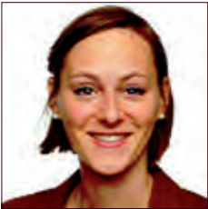
ALLEMAGNE / DEUTSCHLAND

European TK'Blue Agency est une agence de notation extra-financière, spécialisée dans l'analyse des coûts des externalités négatives du transport, particulièrement pour le transport de marchandises. En réponse à un rappel d'offre de l'ADEME, la mission consiste en une « Analyse critique des méthodologies européenne et française de calcul des coûts externes du transport routier ».