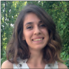
TURQUIE / TURKEY

Fondée sur le principe de l'actionnariat croisé et de l'intérêt commun, l'Alliance Renault-Nissan oeuvre à challenger les processus existants et échanger les meilleures pratiques des deux entreprises. A cette fin, l'Alliance met en oeuvre des actions de convergence. Depuis la création de l'Alliance en 1999, Renault et Nissan conservent une approche différente dans certains domaines.