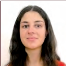
LIBAN / LEBANON

La 21 e conférence des parties de la convention-cadre des Nations Unies sur le changement climatique de 2015 se déroulera du 30 Novembre à 11 Décembre 2015 à Paris. L'objectif est de définir les modalités d'une coordination internationale sur la lutte contre les changements climatiques afin de maintenir le réchauffement mondial sous la barre des 2°C.