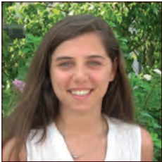
LIBAN / LEBANON

Renault et Nissan mettent en place, depuis 15 ans, des synergies au sein de l'Alliance au bénéfice des deux entreprises dans le cadre de leurs plans stratégiques respectifs à moyen terme : Drive the Change et Power 88. C'est dans ce sens que la Supply Chain Alliance accompagne le groupe dans l'atteinte de ses objectifs à travers l'optimisation des échanges et des flux, la réduction des coûts et l'amélioration de la satisfaction clients. L'Alliance Logistics Europe, dont le périmètre s'étend de l'Europe Occidentale jusqu'à l'Eurasie (Russie, Roumanie et Turquie) ainsi que le Maroc, oeuvre afin de définir une supply chain convergée conditionnée par la complexité et la taille de Renault.