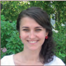
ROUMANIE / ROMANIA

L'Alliance Renault-Nissan, un des acteurs les plus engagé pour réduire son empreinte carbone (de 3% par an et par véhicule), présente sa solution en termes de mobilité.