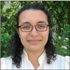
MAROC / MOROCCO

Dans le cadre du mid-term plan 2014-2016 lancé comme une suite logique du plan Renault Drive the Change, l'Alliance Renault-Nissan s'est penchée, à tous les niveaux internes (Supply Chain incluse) sur une démarche orientée vers la satisfaction client pour hisser l'image du groupe, et gagner de nouvelles parts de marché. La mission consiste tout d'abord en l'élaboration d'un classement mensuel des pays dans lesquels Renault et Nissan sont implantés sur la base des principaux indicateurs de performance qui touchent directement le client final (Qualité, Temps et Coût).