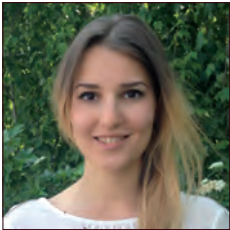
RUSSIE / RUSSIA

La mission de la Direction Ingénierie Environnement (DEA-TC) est la prise en compte de l'environnement par les équipes de conception des véhicules. Aujourd'hui, il est incontournable d'intégrer la notion d'environnement dans la conception des Modules.