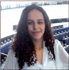
MAROC / MOROCCO

La dépendance à la voiture individuelle est une réalité forte en milieu rural. L'insuffisance de l'offre en transport en commun combinée à l'irrégularité de la demande n'est pas à même de modérer l'auto-solisme pour favoriser l'usage d'autres formes de mobilité partagée.