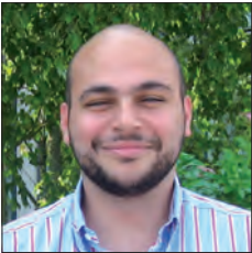
LIBAN / LEBANON

L'économie circulaire se présente comme un nouveau concept économique dont l'objectif est de produire des biens et services tout en limitant la consommation, et surtout le gaspillage de matières premières et énergies non renouvelables.