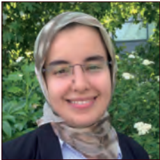
MAROC / MOROCCO

Le Plan de Déplacement d'Entreprise (PDE) est devenu obligatoire depuis l'an 2008 suite à l'approbation du Plan de Protection de l'Atmosphère (PPA) de l'île de France par arrêté inter préfectoral. Le PDIE, ou plan de déplacement inter-entreprises, qui est un PDE commun à plusieurs entreprises est quant à lui une démarche non obligatoire fortement encouragée par le PPA.